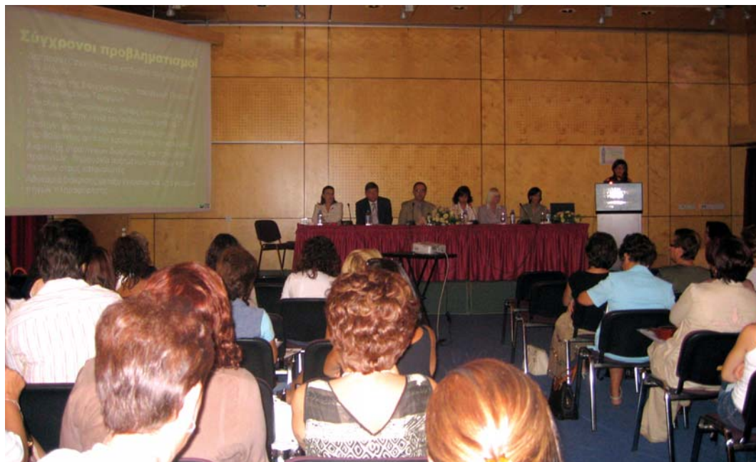
1ο Συνέδριο Οικογενειακής Αγωγής Οκτώβρης 2006

Για τον εκπαιδευτικό κόσμο ομένο το Νέο Έτος 2007