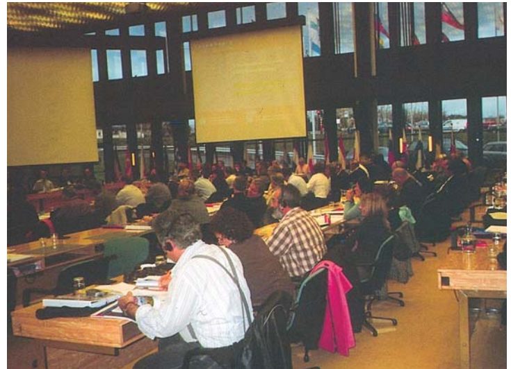
Τακτική Εκλογική Συνέλευση Ευρωπαϊκής Συνομοσπονδίας Εκπαιδευτικών Οργανώσεων - Raneurorean - ETUCE Λουξεμβούργο 4-6 Δεκεμβρίου 2006.